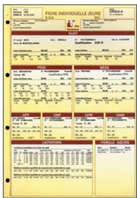
La fiche jeune : dans les 4 mois qui suivent la naissance des veaux