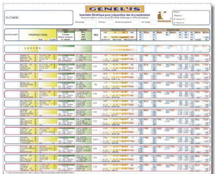
Le bilan génétique avec des propositions d'accouplements