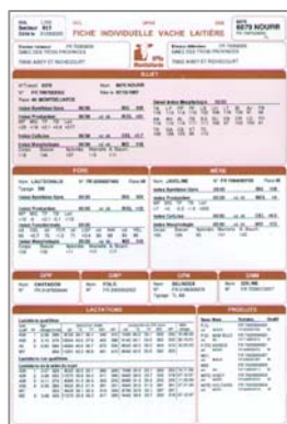
*FIVL : fiche individuelle vache laitière (éditée à la suite d'un tarissement)